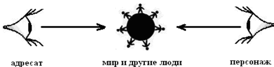
Рис. 2. Принцип психологической идентификации

Драма, в этом случае, оказывается «на перепутье» между эпосом и лирикой – данное наблюдение подтверждается наличием таких дефиниций, как народная драма и лирико-психологическая драма. Присутствие в истории драмы подобных модификаций очередной раз подтверждает её динамическую природу и промежуточное положение.