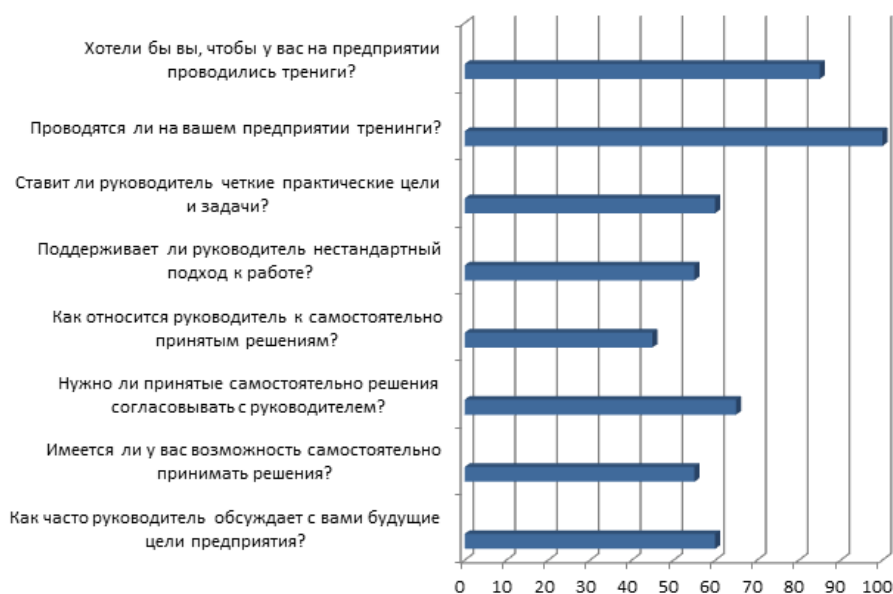
Рисунок 1 - Анализа коуч-технологий

Учитывая отсутствия инструмента анализа коуч-технологий на предприятии нами была разработана анкета экспресс-диагностики, позволяющая определить уровень коучинговой культуры, и проведено пилотное исследование (Рисунок 1).